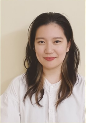
Sususumirenkohn すすすみれんこーん