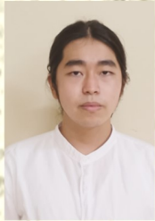
Nagatomo Keigo 長友 啓悟